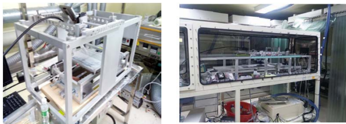
圖三：(左)本團隊自行研發之30公分行程刮刀機台 (右)120公分行程機台組裝中