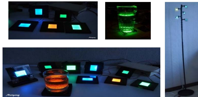
圖四：本團隊製作之低成本OLED 裝飾性照明